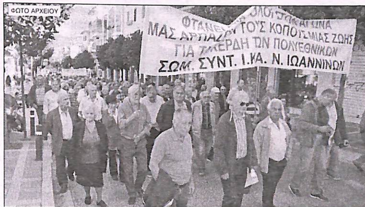
Την αγωνία των συνταξιούχων για τις επιστροφές παρακρατηθέντων χρημάτων, όπως την εκφράζουν συχνά και οι οργανώσεις τους στα Γιάννενα, ετοιμάζεται να χρησιμοποιήσει ως «προεκλογικό χαρτί» η Κυβέρνηση του ΣΥΡΙΖΑ...

• Σε καθεστώς ομηρίας ετοιμάζεται να θέσει η Κυβέρνηση του ΣΥΡΙΖΑ τους συνταξιούχους του Δημοσίου και Ιδιωτικού τομέα, ενόψει των επικείμενων εκλογικών αναμετρήσεων. Το σχέδιο αυτό αναμένεται να τεθεί σε εφαρμογή αμέσως μετά την απόφαση που αναμένεται να βγάλει τις ε-